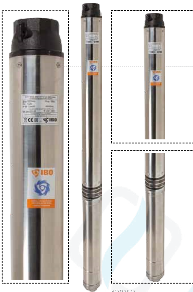
6" SD 25-13