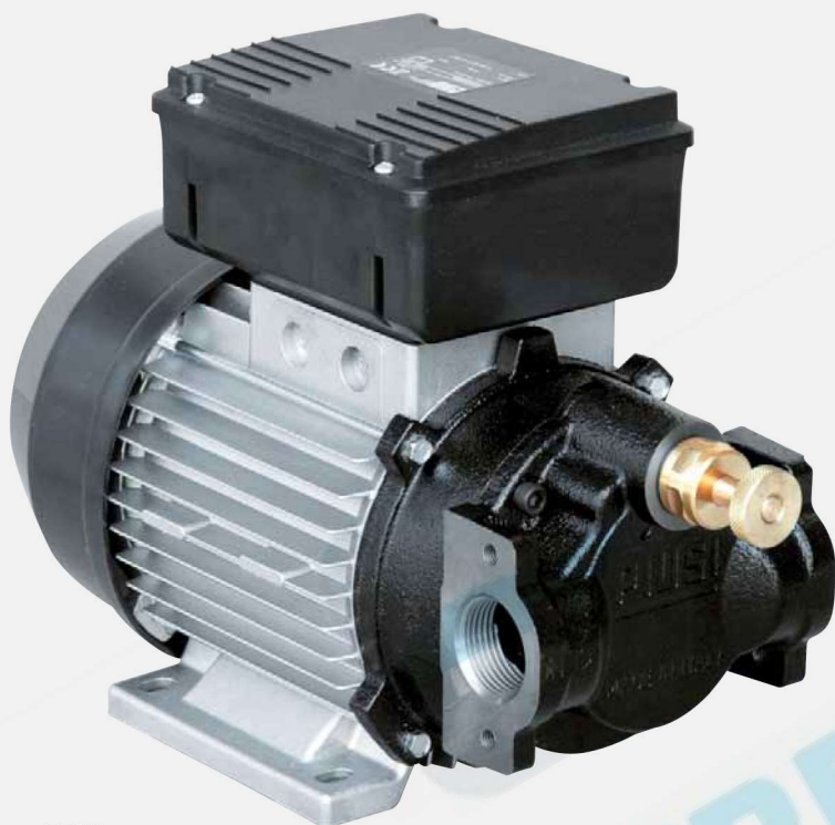
Viscomat 70 M