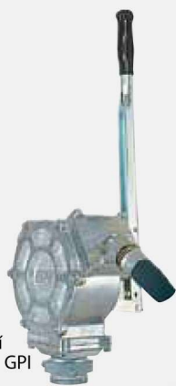
Pístové ruční čerpadlo PM GPI F0031600A