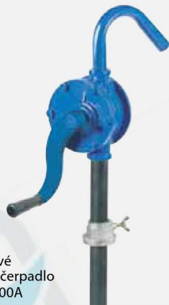
Hliníkové rotační čerpadlo F0033200A