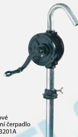
Litinové rotační čerpadlo F0033201A