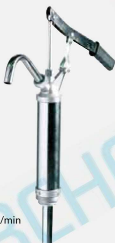
Pístové ruční čerpadlo 25 l/min F0034900A