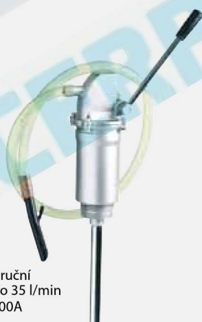
Pístové ruční čerpadlo 35 l/min F0035100A