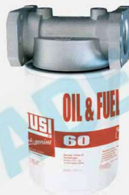
Filtr 60 l/min s hlavou