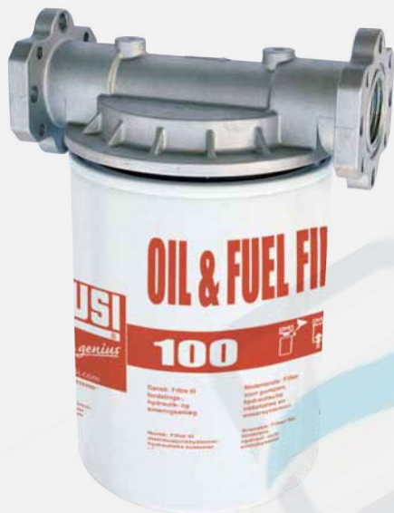
Filtr 100 l/min s hlavou