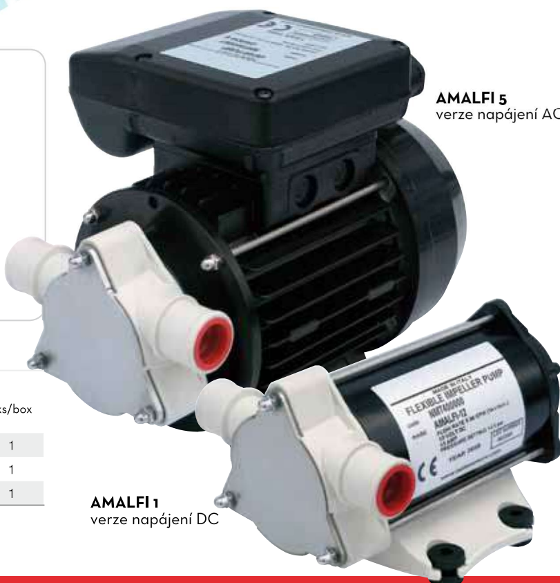
AMALFI 5 verze napájení AC