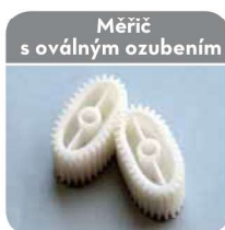
Měřič s oválným ozubením

5-místný dílčí i celkový údaj (vynulovatelný) -možnost kalibrace -ikonka slabé baterie