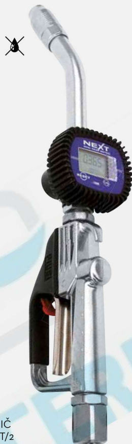
MĚŘIČ NEXT/2 + pevný nástavec