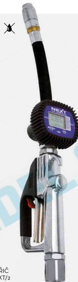
MĚŘIČ NEXT/2 + flexibilní nástavec