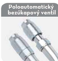
Poloautomatický bezúkapový ventil