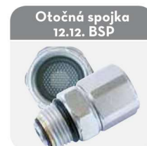
Otočná spojka 12.12. BSP