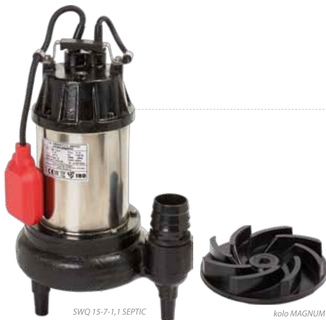
SWQ 15-7-1,1 SEPTIC