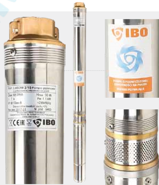
3,5" SDM 3/15

VYUŽITÍ: Čerpání z hlubinových vrtů k rozvodu vody v rodinných domech, na malých farmách anebo k zavlažování zahrad či odvodňování prostor.