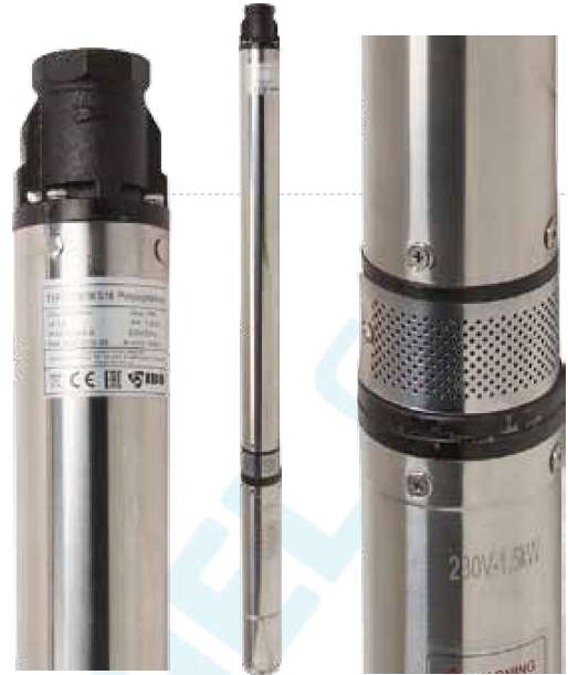
3" SCM 3-18

VYUŽITÍ: Čerpání z hlubinových vrtů k rozvodu vody v rodinných domech, na malých farmách nebo k zavlažování zahrad či odvodňování prostor.